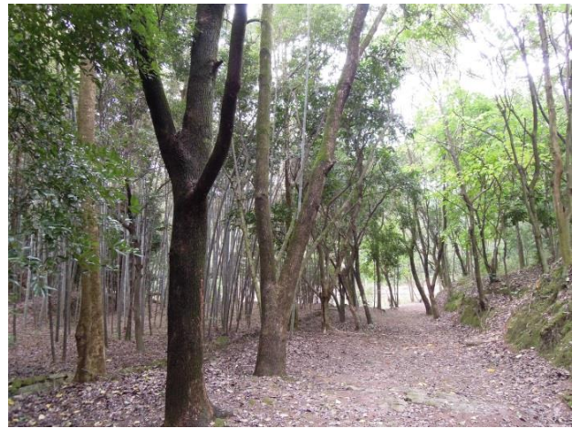
2014 年 11 月攝