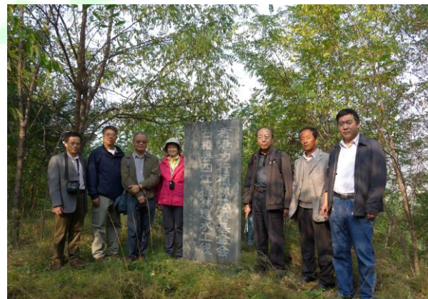
樹苗已經生長成林