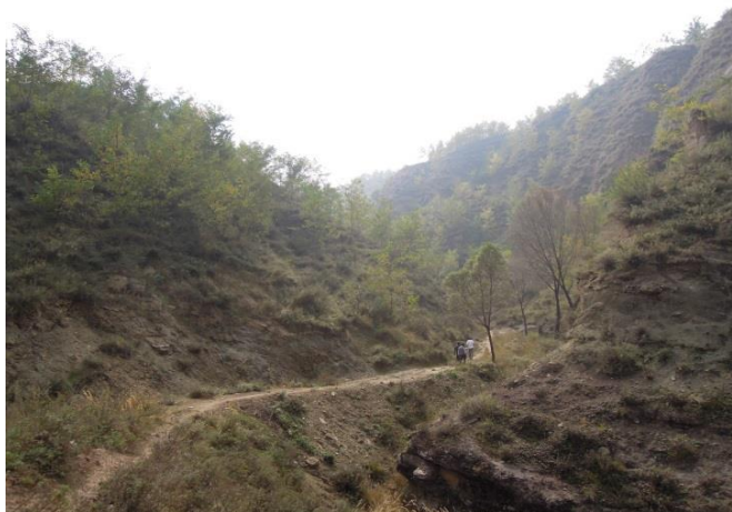
出現水源的植林區山谷

基金會自 2007 年開始，種下的苗木，很多已經成林了。在 6 月份和 10 月份，義工視察植林區時，林場的情況都很穩定，存活率保持在 85% 或以上。在 2010 年山谷中出現的水源，已經增大成寬度約 5 英尺，而長約 15 英尺、約 4-5 英尺深的一個小池塘。村民希望能建些小型水利工程，引帶出泉水、通過管道供村民食用。