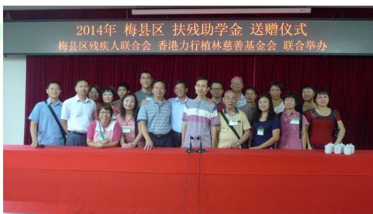
謝謝各位工作人員，下次再會

在助學金送贈儀式上，鄧醫生代表基金會勉勵各同學，要調整積極的心態。每個人無法選擇在怎樣的 2 家庭出生（富有或貧困，健康或殘疾），但我們可選擇以怎樣的 2 心態去面對各種境況，以及盡力發揮自己的能力才華；將來可以照顧家庭，貢獻國家和服務社會。