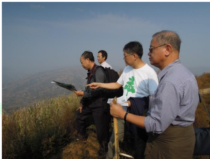
2014 年 10 月攝