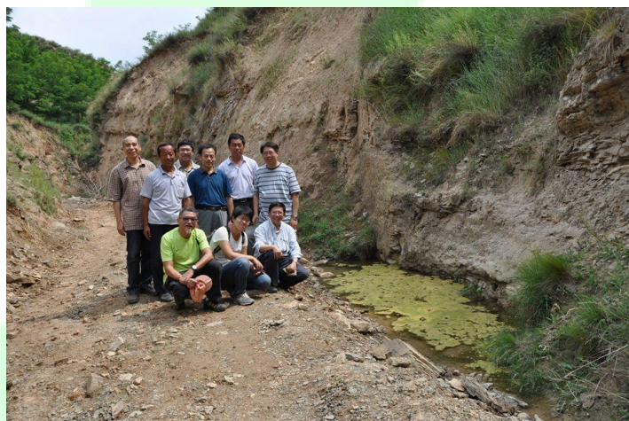
水量不斷增加，義工們感到鼓舞