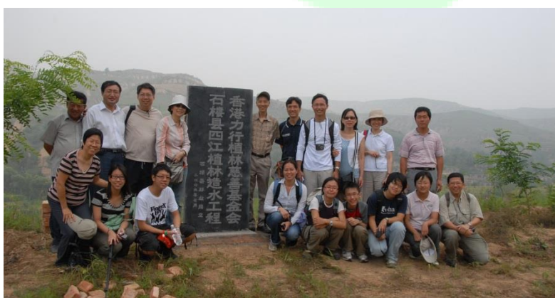
善長，義工們到植林區視察