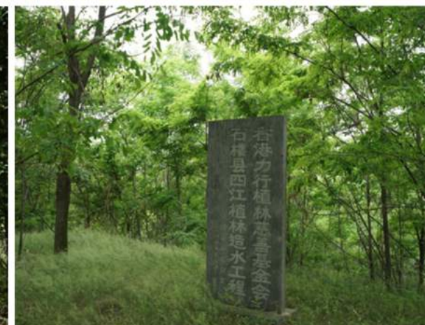
四江村第3區苗木生長情況