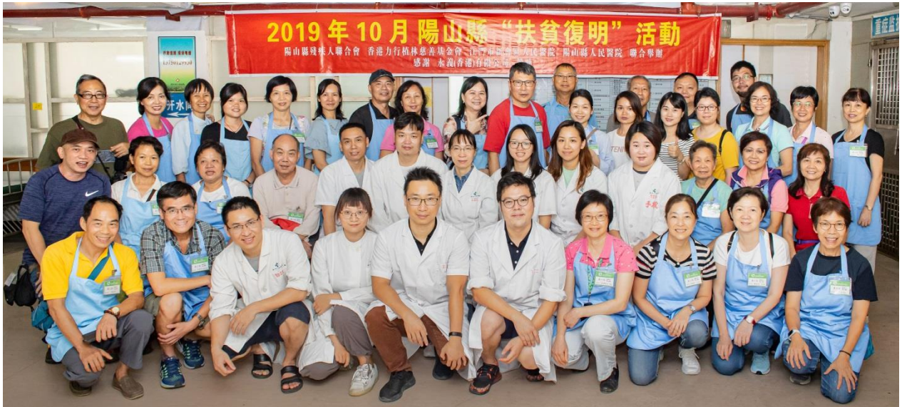
充滿熱誠，活力的組合團隊

贈 力行植林慈善基金會錦旗一面；書云： 愛心助陽情意濃，同享光明義舉美 陽山縣電視台現場採訪並於新聞的時段中作出報導。