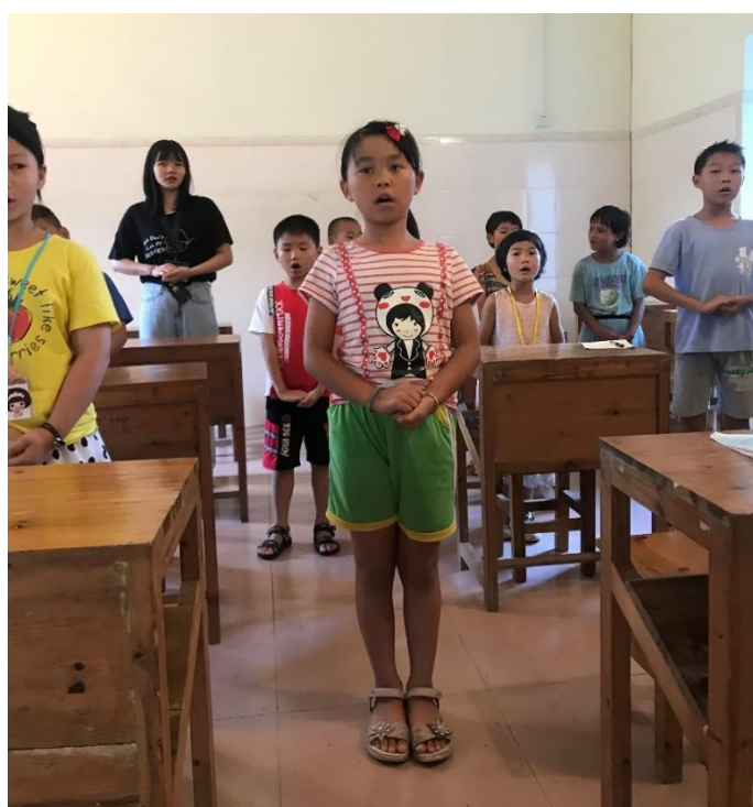
(站出歌唱家的气势)