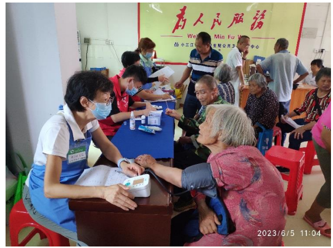
量血壓，測血糖，符合條件者，發出預約手術通知書