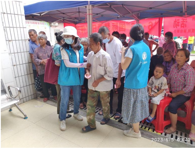
各鄉鎮政府派出社工協助派號及維持秩序