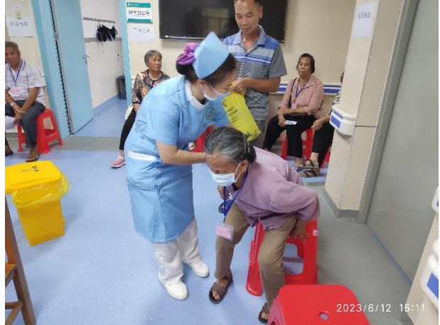
科室醫護為患者一站式辦理住院，驗血，帶患者檢測心電圖，照胸片，盡快集齊各項檢驗報告。