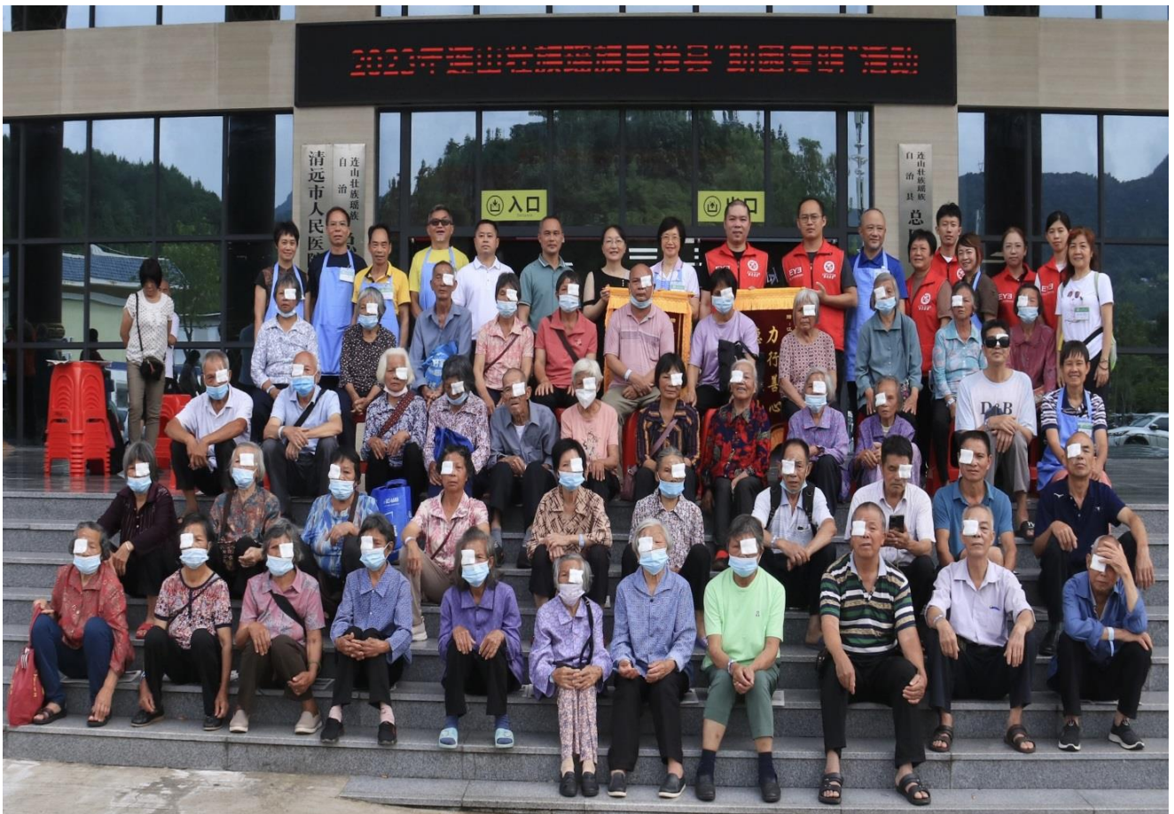
感謝連山縣殘聯，新希望眼科醫療隊，連山縣人民醫院，力行基金會善長義工們，眾多工作人員齊心協力，為貧困白內障患者提供免費、優質的醫療服務。