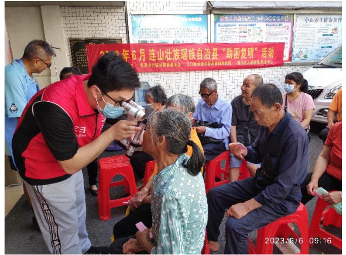
眼科醫生初步篩選，白內障患者隨即由義工帶往登記