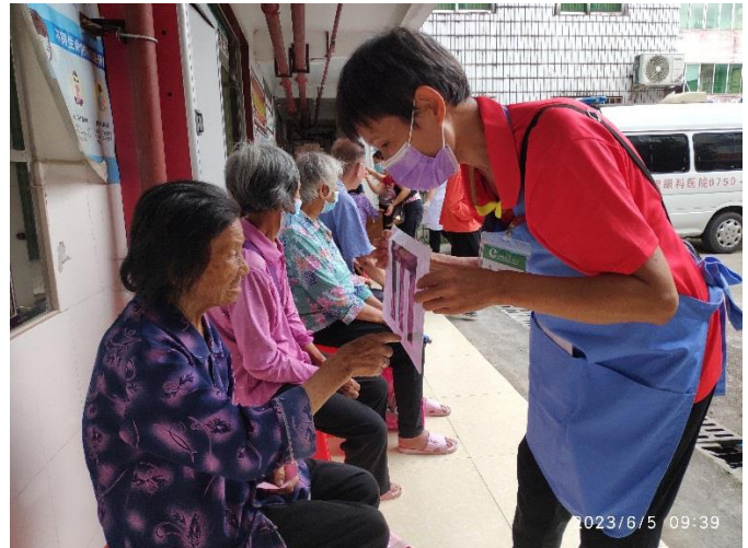
教導長者表達符號的開口方向