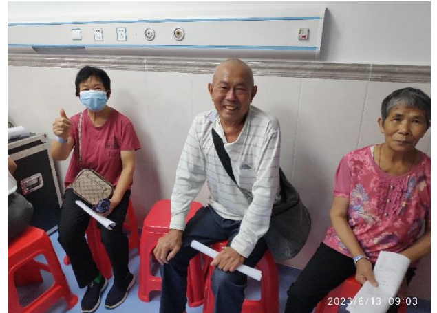
術後翌日檢查，打開紗布，都看清楚了，好開心！