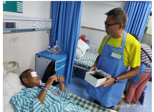
義工探望手術後患者，提示注意事項，並送贈太陽眼鏡。