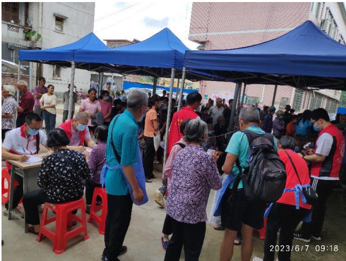
白內障患者登記後即由義工帶往下一步檢查