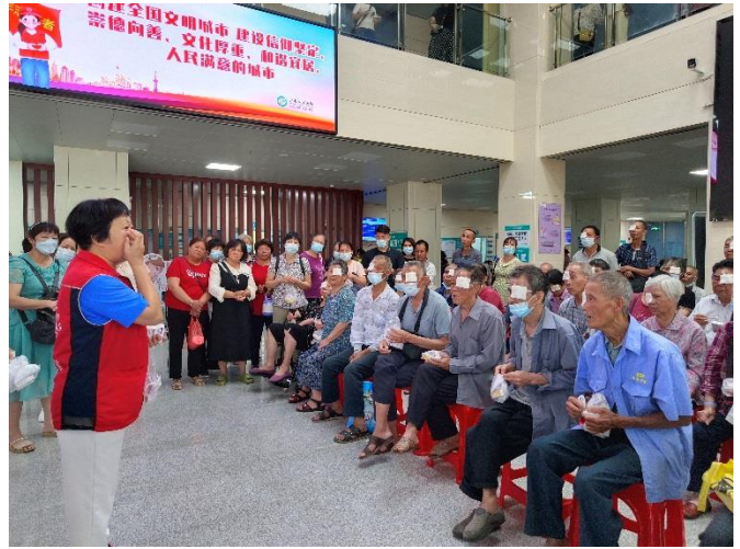
派發出院藥物，再次向患者和家屬講解；示範如何用藥、眼膏使用方法、術後護理，防止受感染。