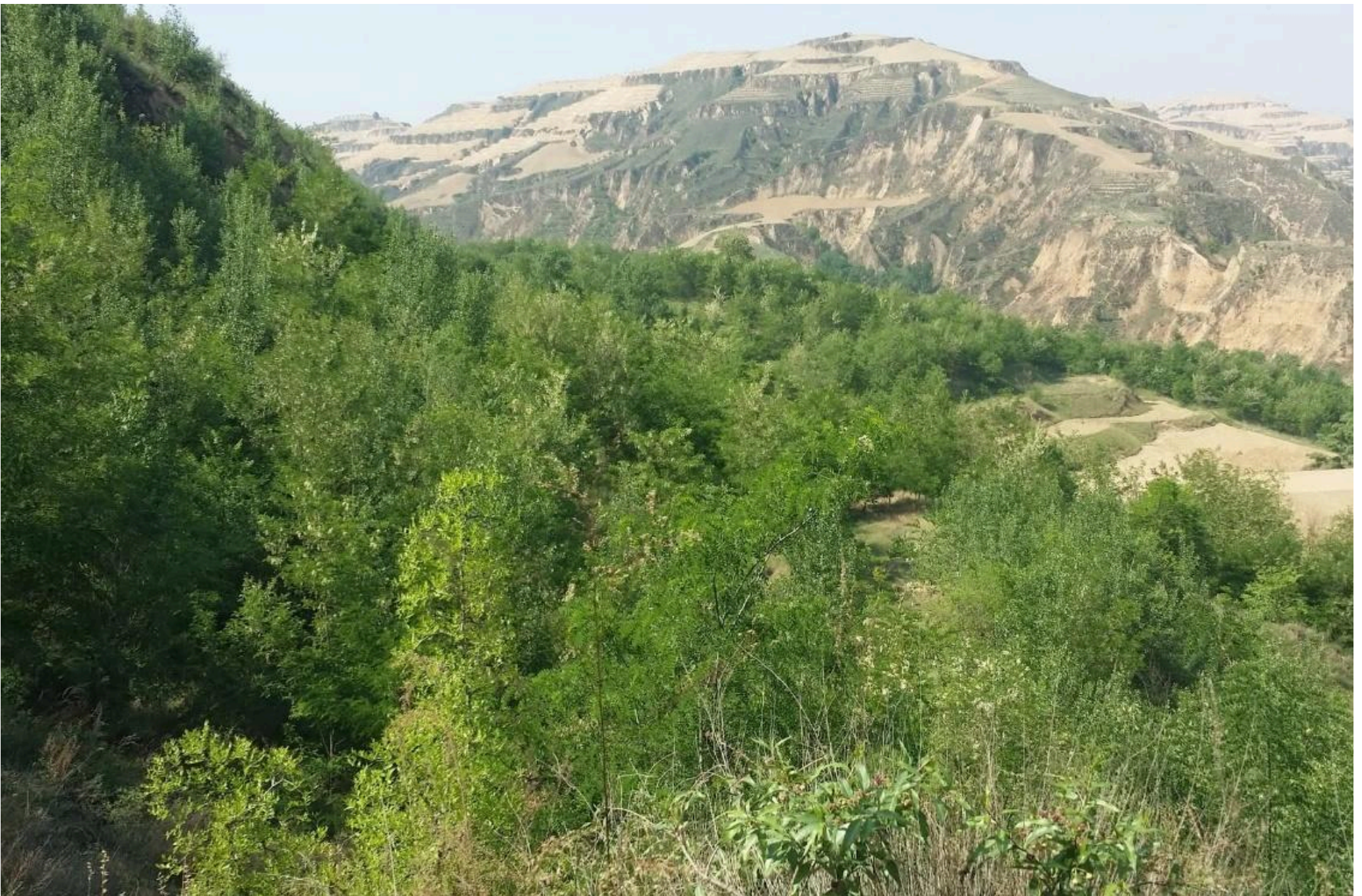
四江村，力行植林區，樹木生長近況