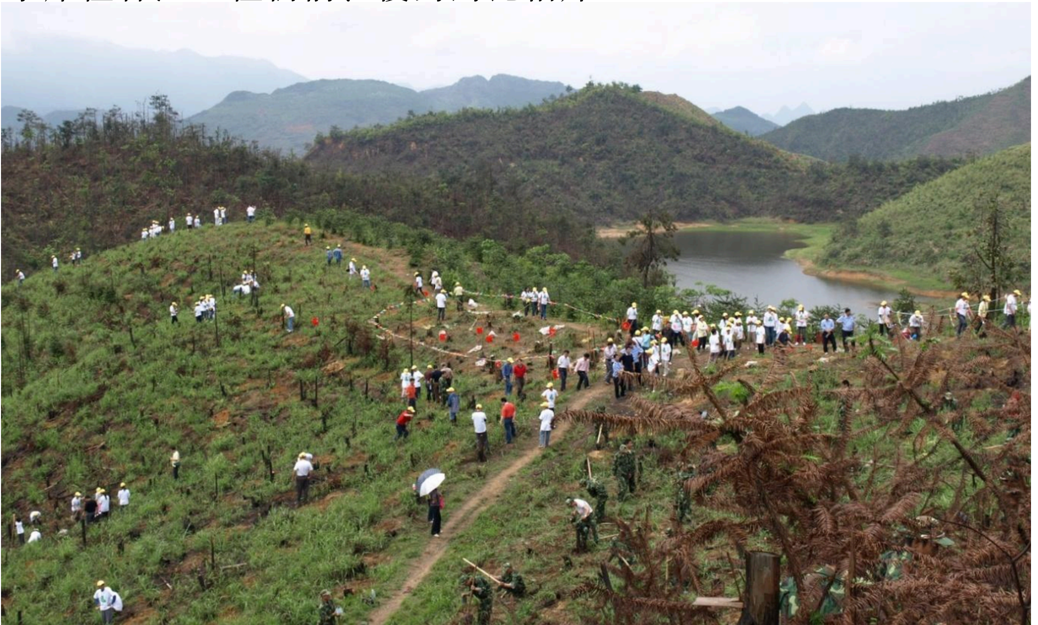
水庫植林區- 植樹日活動