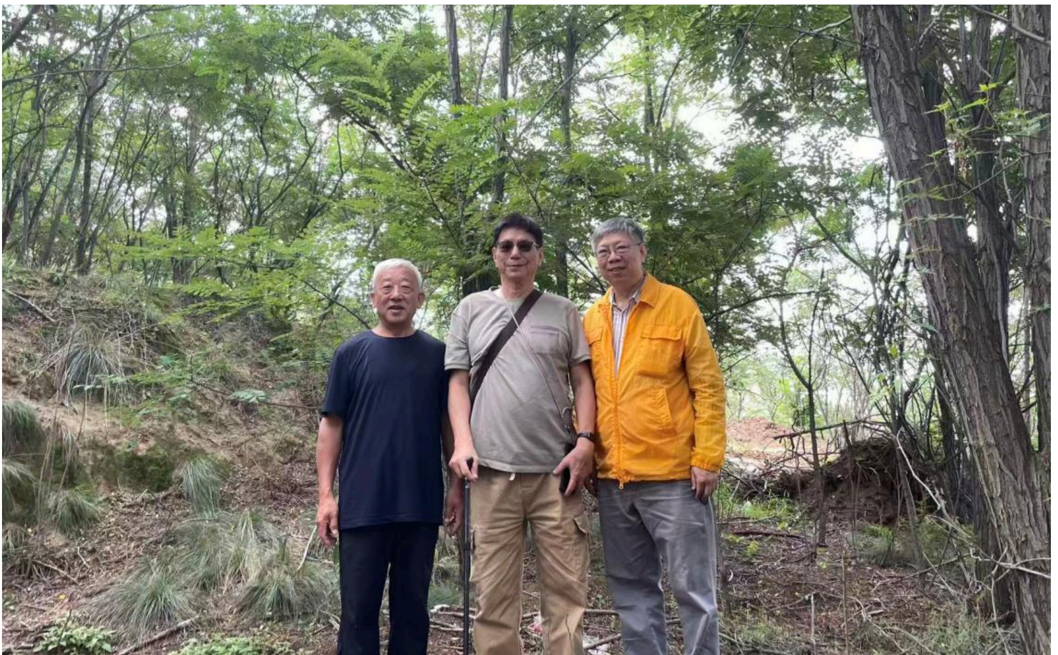
喜見黃土高坡上，當年苗木已成林