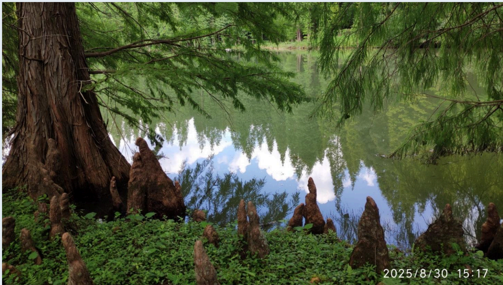
雲茶植林區內，池杉長出的呼吸根，形態各異